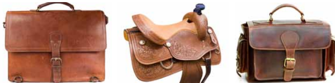
Deri ve Deri Ürünleri İhrac Değerleri (1.000 USD) (Export)

Dünya deri ürünleri ihracatında ilk on ülke ve Türkiye rakamları aşağıdaki tabloda sunulmuştur.