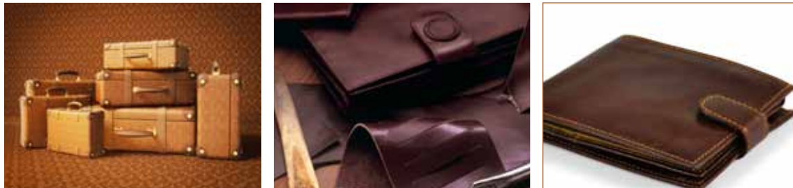
Deri ve Deri Ürünleri İthalat Değerleri (1.000 USD) (Export)

Dünya deri ürünleri ithalatında ilk on ülke ve Türkiye rakamları aşağıdaki tabloda sunulmuştur.