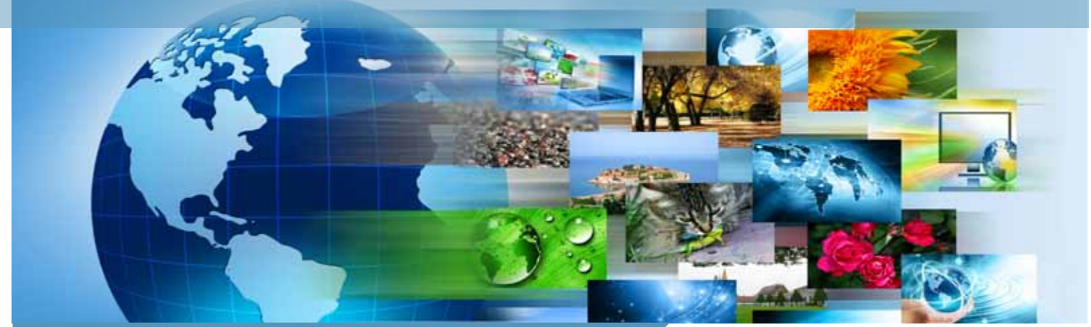
Tablo 4. Coğrafi Bölümleme